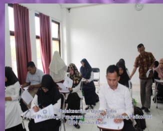
Rekapitulasi Guru Tulis Dosen Psikologi Program Magister Fakultas Psikologi UIN Suska Riau