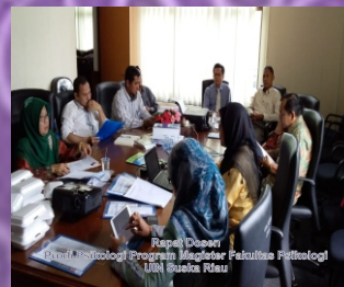
Rekapitulasi Dosen Dosen Psikologi Program Magister Fakultas Psikologi UIN Suska Riau