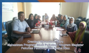
Grand Opening Magister Ilmu Psikologi Pascasarjana Program Studi Psikologi Pascasarjana Fakultas Psikologi UIN Suska Riau