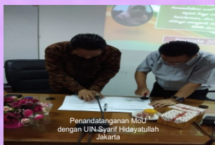
Penandatangan Mobile dengan UIN Syarif Hidayatullah Jakarta