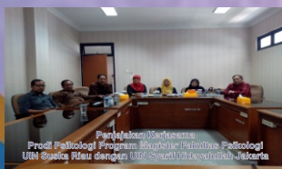
Pengukuhan Dosen Tetap Prodi Psikologi Pascasarjana Fakultas Psikologi UIN Suska Riau dengan UIN Syarif Hidayatullah Jakarta