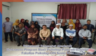
Keputusan Badan Akademiik Mahasiswa Program Studi Psikologi Pascasarjana Fakultas Psikologi UIN Suska Riau