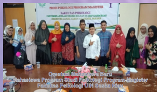
Grand Opening Magister Ilmu Psikologi Pascasarjana Program Studi Psikologi Pascasarjana Fakultas Psikologi UIN Suska Riau