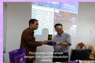
Penerahan Cideramata dengan UIN Syarif Hidayatullah Jakarta